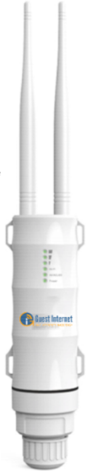
Acceda al GIS-K7 a través de Internet para imprimir ficha

Los productos de Guest Internet se utilizan en más de 50 países de todo el mundo.